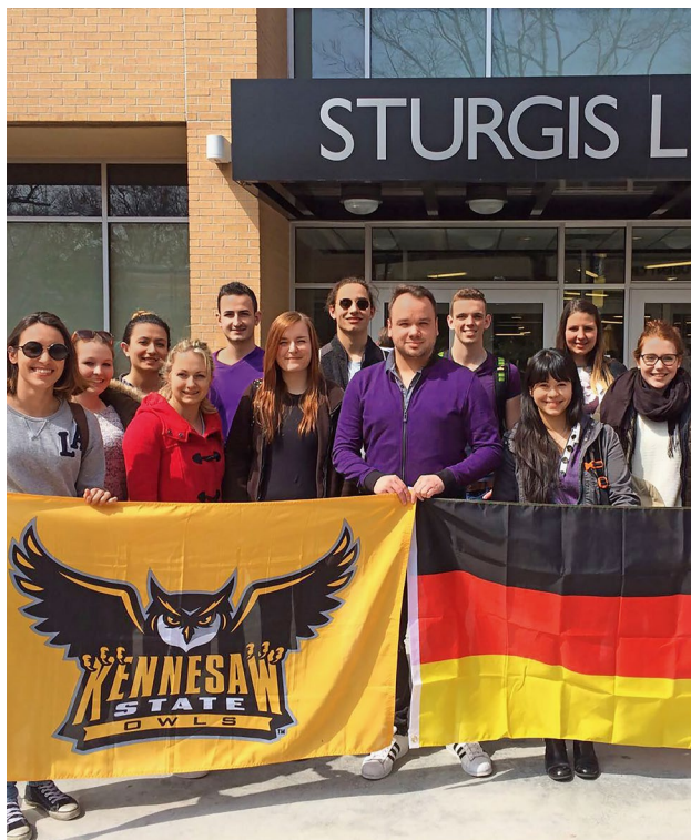
▲ Austauschgruppe an der Kennesaw State University in Kennesaw, Georgia.

Für Ihr laufendes Austauschprogramm brauchen Sie kurzfristig einen Zuschuss, um noch offene, kleinere Beträge zu finanzieren?