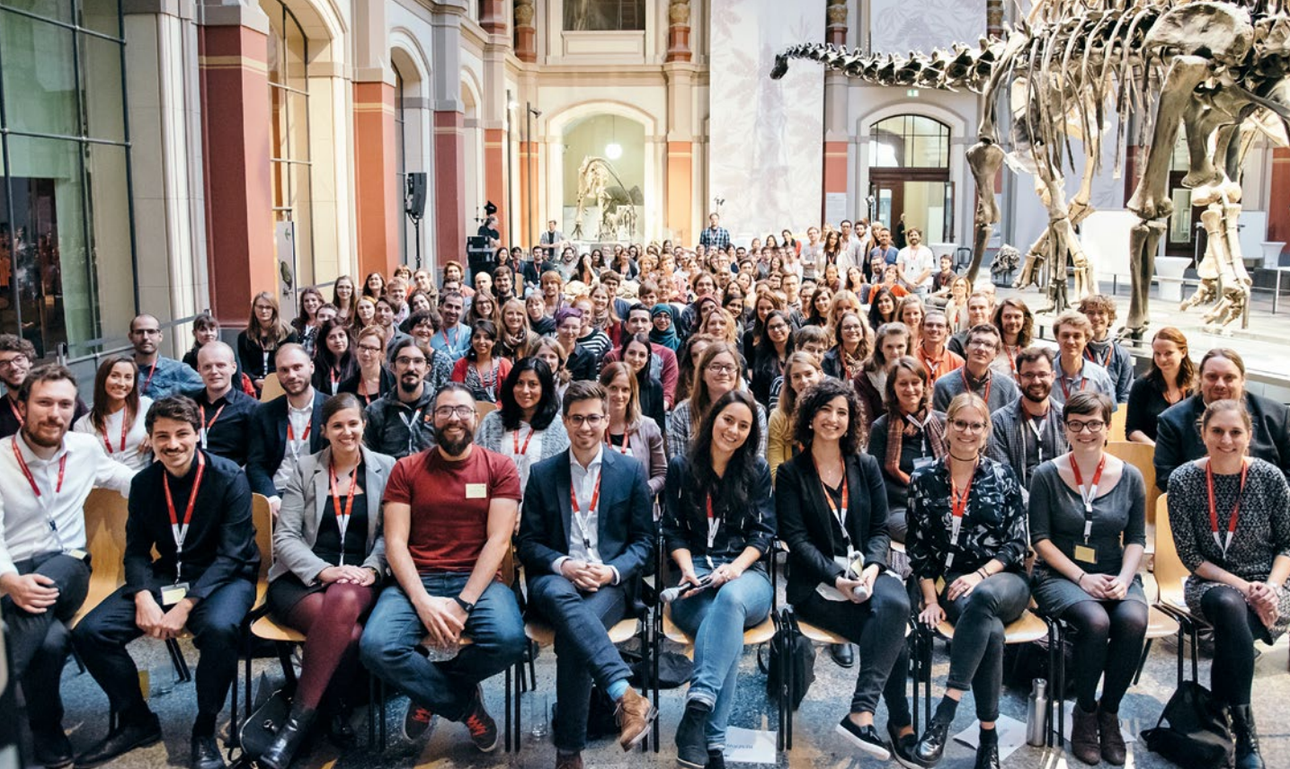
▲ Teilnehmer einer Konferenz, die durch das Projekt gefördert wurde. Participants in a conference that was funded by the project.